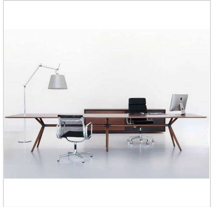
Image Executive Desk

Anfragen bitte kategorisieren: Executive Office (34m 2 ), Duo-Office (17m 2 ), Junior Office (17m 2 ), Fix- und Flexidesk, größere Flächenbedarfe.